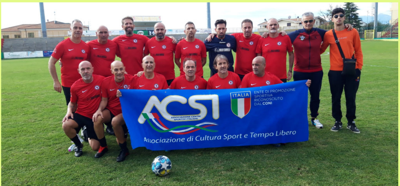
Squadra Veterani RC Over 50 Foggia

Sono stati formati e sorteggiati 2 gironi a 3 squadre, e nell'ordine classificati: il girone A: VETERANI RC OVER 50 FOGGIA, VETERANI GIADA IMMOBILIARE ROMA, CRAL BANCA POPOLARE DI MILANO ; questa la classifica per il girone B: CRAL MONTE PASCHI DI SIENA, VETERANI NIA ROMA, ASD POL. VETERANI MOLFETTA . Questi i risultati FINALE PLAY OUT : 1^ CLASSIFICATA VETERANI NIA ROMA, 2^ CLASSIFICATA GIADA IMMOBILIARE ROMA, 3^ CLASSIFICATA BANCA POP DI MILANO MI, 4^ CLASSIFICATA ASD POL. VETERANI MOLFETTA .