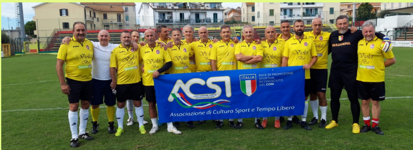
Squadra Veterani Giada Immobiliare Roma