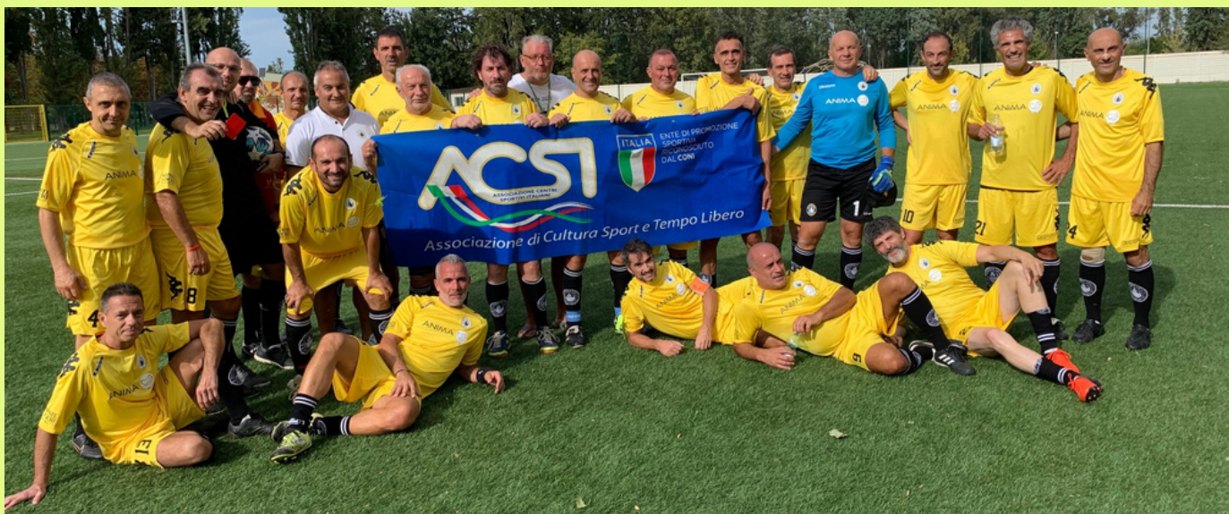
Squadra CRAL Monte Paschi di Siena