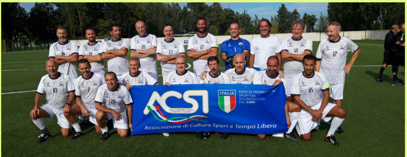
Squadra Veterani NIA Roma