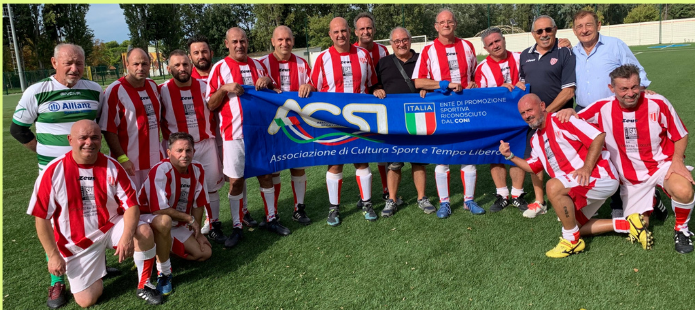
Squadra Veterani Pol. Molfetta