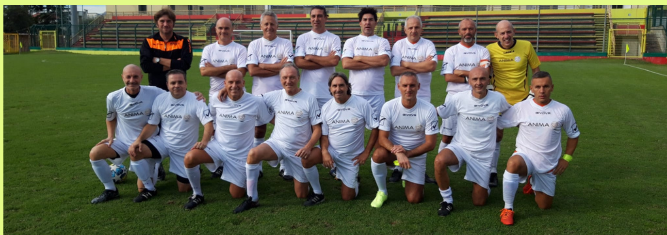
Squadra CRAL Banca Popolare Milano